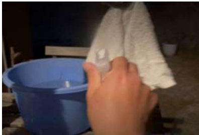
他社アルコール入り冷感スプレー

フリーズテックはまったく燃えなかったのに対し、他社アルコール入りスプレーは一瞬にして炎が広がりました。