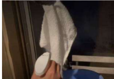
当社フリーズテック冷感スプレー